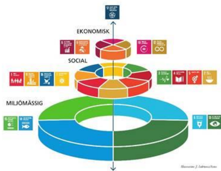
Bild: Bilden illustrerar hur olika aspekter av hållbarhet, och de 17 hållbarhetsmålen, hänger ihop och är beroende av varandra. Det miljömässiga utgör basen, och är avgörande för hur väl vi har möjlighet att uppnå de sociala och ekonomiska målen. Omvänt behövs en ekonomisk utveckling och ekonomiska metoder som hjälper samhället och oss alla att ställa om.