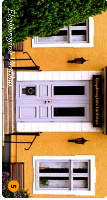
Eksjöhovgård's Visitor House