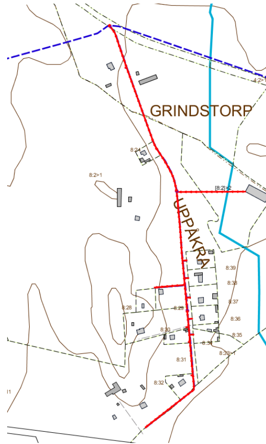
Steg 2 Utbyggnad av ledningar från huvudledning till fastighetsgräns