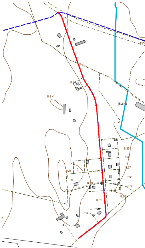
Steg 1 Utbyggnad av huvudledning