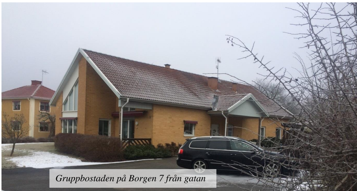
Gruppbestaden på Borgen 7 från gatan