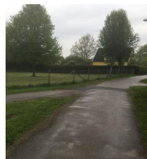
Området sett från norr