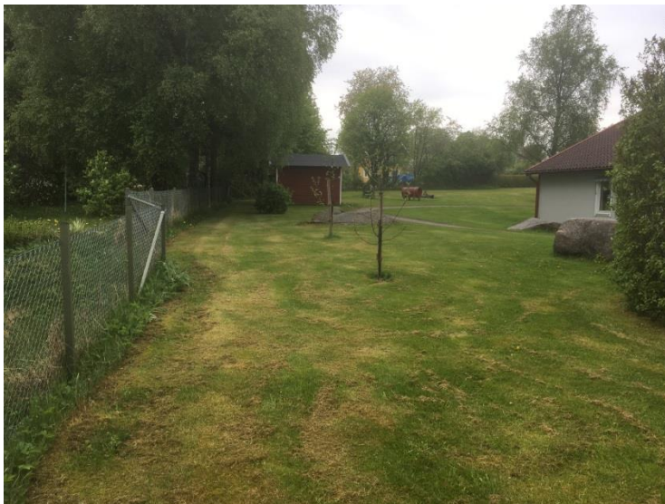
Bilden visar planområdets södra gräns mot fastigheten Stockaryd 2:104

Allmänhetens tillgång till delar av aktuellt område är och har varit begränsad. Den minskade tillgången på naturmarken får vägas mot det allmänna intresset av en utbyggnad av barnomsorgen. Aktuellt grönområde har varit ianspråktaget som tomtmark under mer än tjugo år kanske betydligt längre. Allmänhetens tillgång till värdefulla områden för rekreation och friluftsliv i och i anslutning till Stockaryd är fortsatt mycket god.